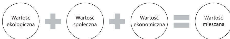
Rysunek 1. Schemat potrójnej linii przewodniej (wartość mieszana)